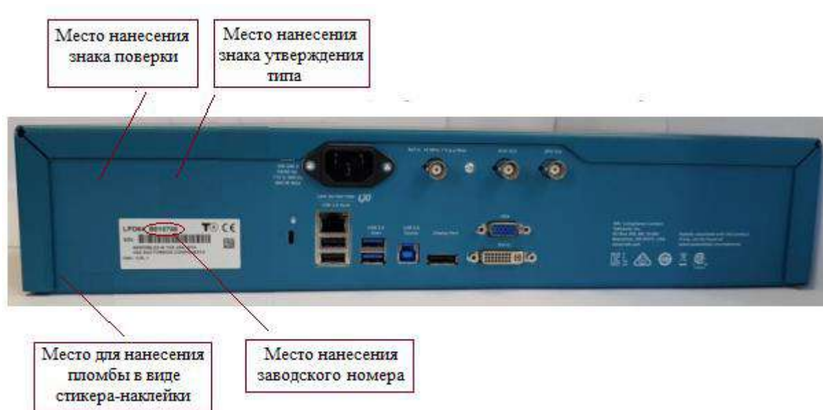
Рисунок 1. Общий вид средства измерений с указанием мест пломбировки (для стикера-наклейки), мест нанесения знака утверждения типа, знака поверки, заводского номера

Нанесение знака поверки на средство измерений не предусмотрено. Заводской номер в виде цифро-буквенного обозначения, состоящего из арабских цифр и букв латинского алфавита, наносится ударным способом на табличку в месте, указанном на рисунке 1.